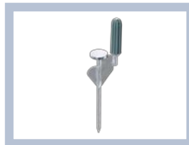
Bodenverankerung, um Expolinc Flag System z.B. auf Rasen zu sichern.