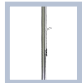
Das flaggen seil ist leicht festzumachen.

ANLEITUNGEN – SIEHE DEN GANZEN FILM UNTER WWW.EXPOLINC.DE