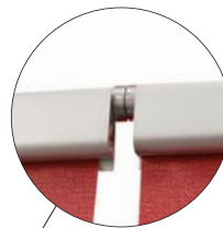
Expand's patentierten Magnetic Connector