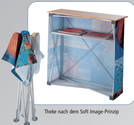
Theke nach dem Soft Image-Prinzip