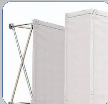
Wahlweise mit oder ohne Seitenteil