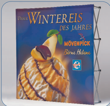
Soft Image genügt höchsten Ansprüchen