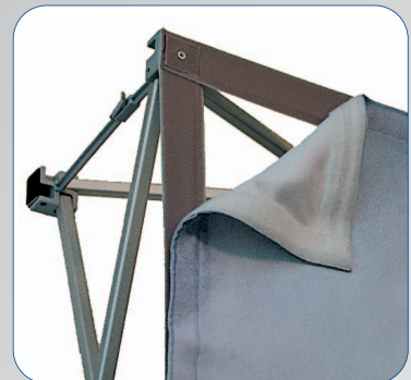
Einfachster Grafikwechsel durch Klettbefestigung