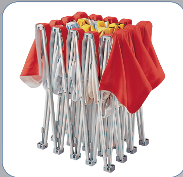
Die Grafik verbleibt am System