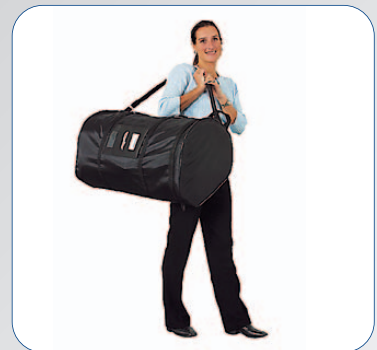
Alles findet Platz in der Nylontasche