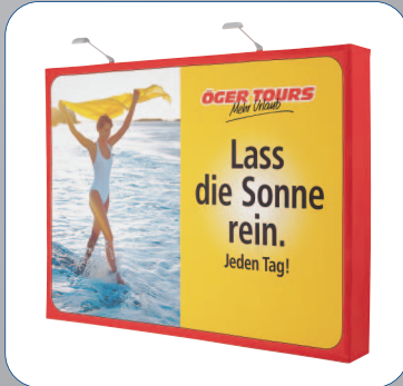
In Sekundenschnelle perfekt inszeniert